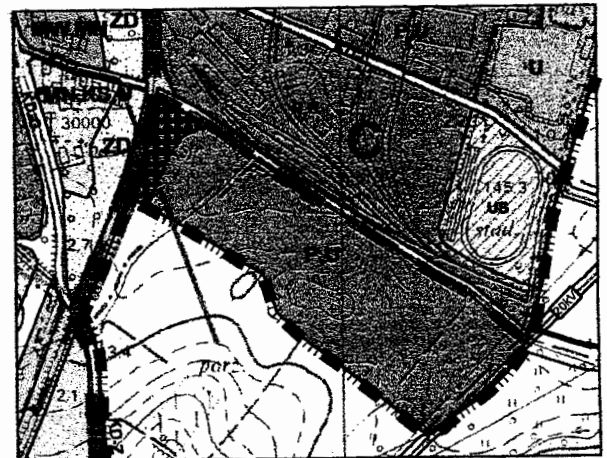
WYRYS ZE ZMIANY STUDIUM UWARUNKOWAŃ I KIERUNKÓW ZAGOSPODAROWANIA PRZESTRZENNEGO MIASTA CHOJNÓW

Załącznik nr 1 do Uchwały nr LII/251/06 Rady Miejskiej Chojnowa z dnia 25 stycznia 2006 r. w sprawie uchwalenia zmiany miejscowego planu zagospodarowania przestrzennego rejonu ulicy Łużyckiej w zakresie jednostki bilansowej 2TDL1/2(Z1/2)